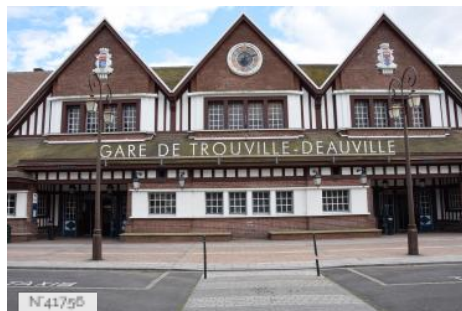
Gare SNCF de Trouville-Deauville