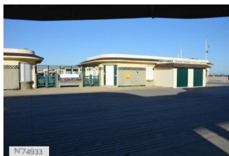
Les bains pompéiens de Deauville