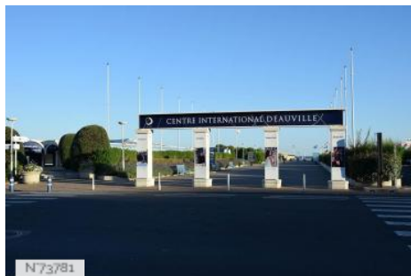
Centre International de Deauville - Extérieur