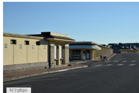
Plage Les Planches Été de Deauville