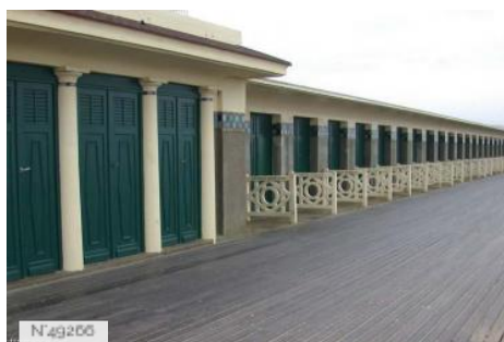
Plage Les Planches Hiver de Deauville