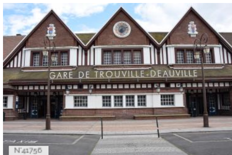
Gare SNCF de Trouville-Deauville