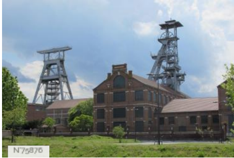
Studios d'Arenberg Creative Mine