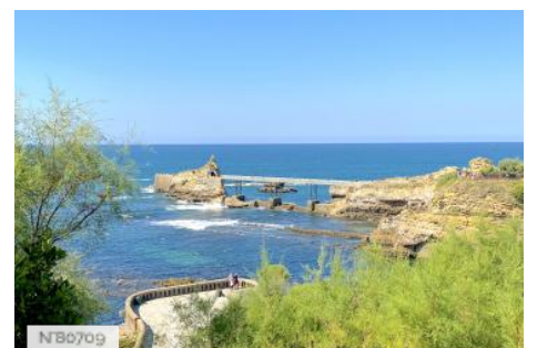
Plage de la Côte des Basques à Biarritz