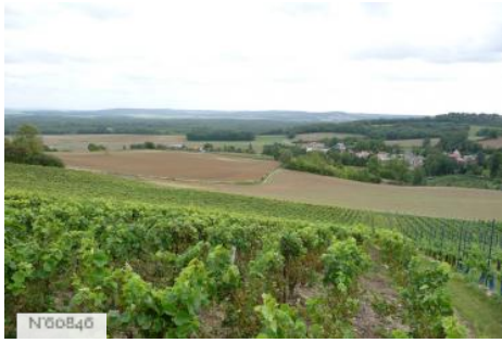
Société vinicole - Vignes