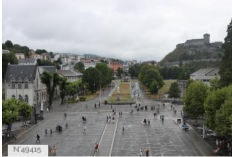
Ville de Lourdes