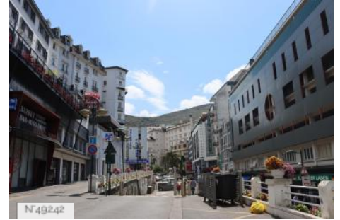
Rues de Lourdes