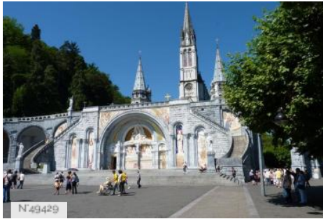
Basilique de l'Immaculée Conception