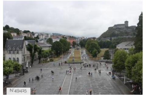
Ville de Lourdes