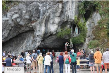
La Grotte de Lourdes