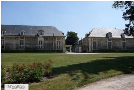
Haras National - Extérieur des bâtiments