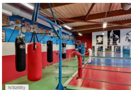
Salle de boxe