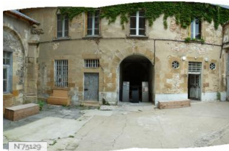
Mal Coiffée - Ancienne Prison - Cour Entrée - Moulins