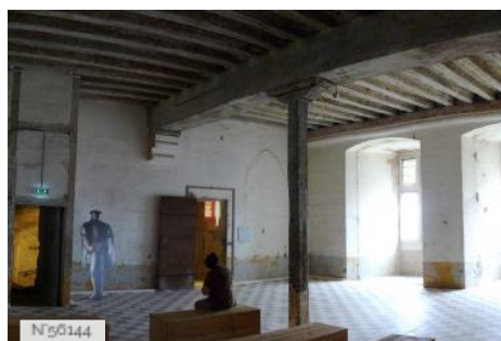
Mal Coiffée - Ancienne Prison - Salle 2eme Etage - Moulins