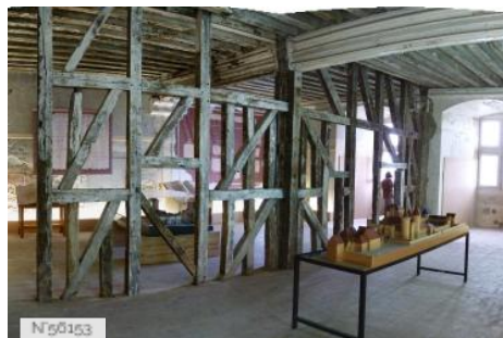
Mal Coiffée - Ancienne Prison - Salle Rdc Pans de Bois - Moulins