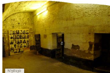
Mal Coiffée - Ancienne Prison - Cachots Sous Sol - Moulins