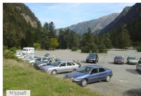
Parking du Pont d'Espagne - Cauterets