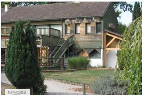
Bâtiments dans un domaine naturel