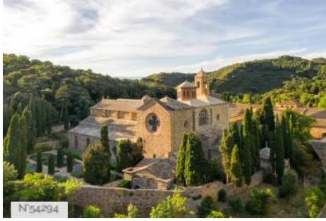
Abbaye de Fontfroide - Extérieurs