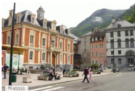
Ville de Cauterets