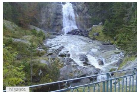
Cascades du Pont d'Espagne à Cauterets