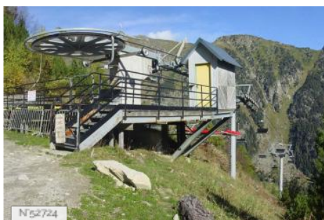
Télesiège de Gaube à Cauterets