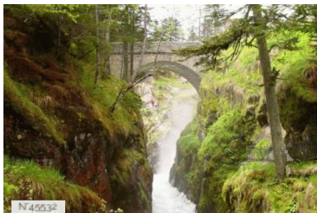
Pont d'Espagne à Cauterets