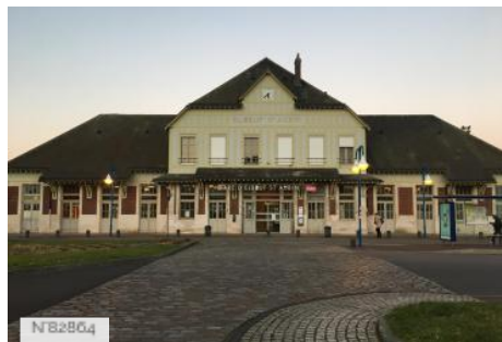
Gare SNCF Saint Aubin les Elbeuf