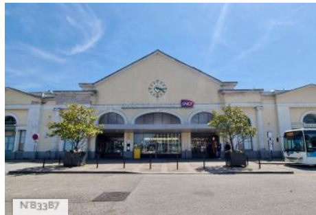
Gare SNCF de Dieppe