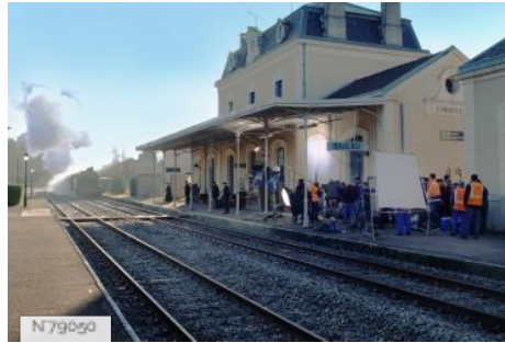
Pôle Cinéma et Tournages SNCF