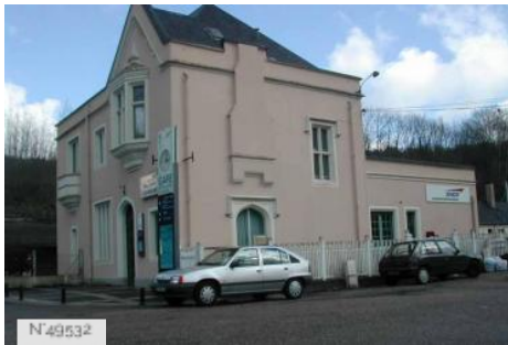
Gare SNCF Malaunay-Le Houlme