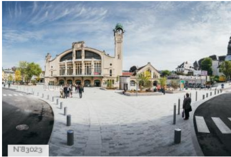
Parvis de la Gare de Rouen Rive Droite