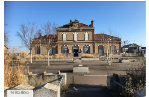
Gare SNCF Oissel