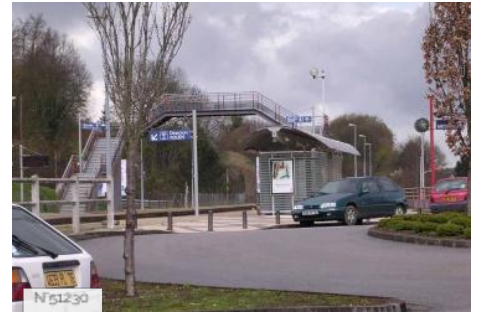
Gare Passerelle SNCF de Montville