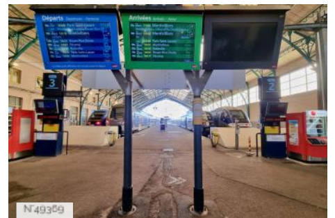
Gare SNCF du Havre