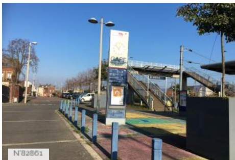
Gare SNCF Saint-Etienne du Rouvray