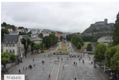
Ville de Lourdes