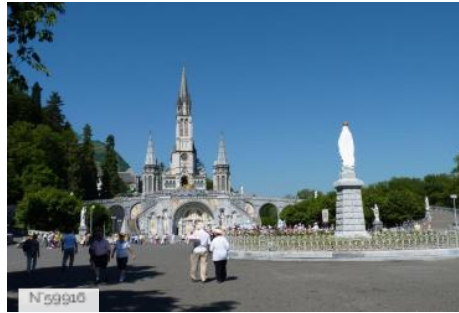
Sanctuaire de Lourdes