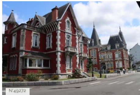
Mairie de Lourdes