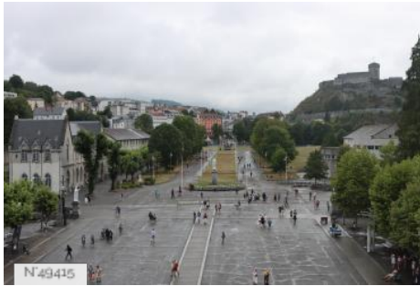
Ville de Lourdes