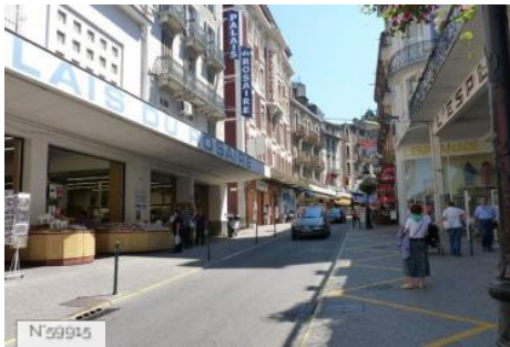
Boulevard de la Grotte à Lourdes