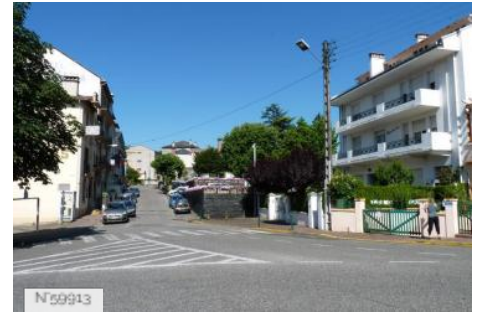
Avenue Hélios à Lourdes