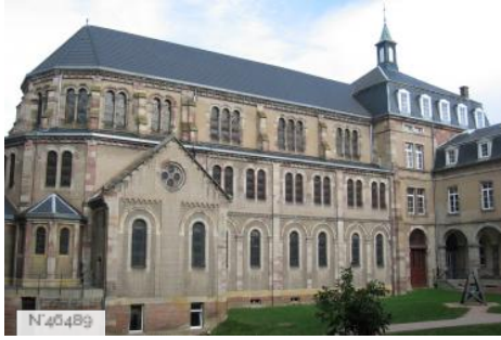
Chapelle Épiscopale - Zillisheim