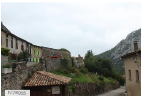
N 78955 Village de Montségur