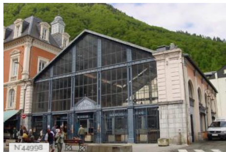
Les halles de Cauterets