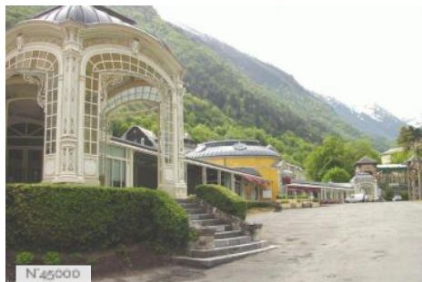
Esplanade des Oeufs à Cauterets