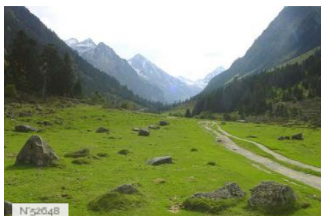
Vallée de Lutour "La Fruitière" à Cauterets