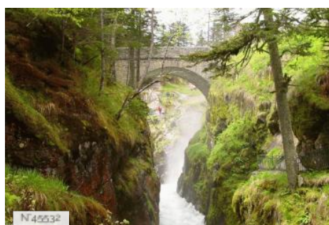
Pont d'Espagne à Cauterets