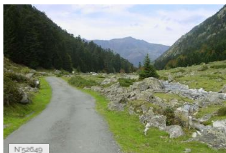
Route de la Vallée de Lutour à Cauterets