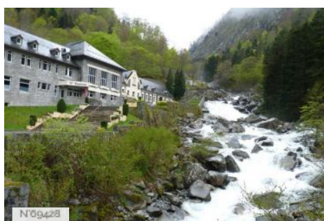
Thermes Les Griffons à Cauterets