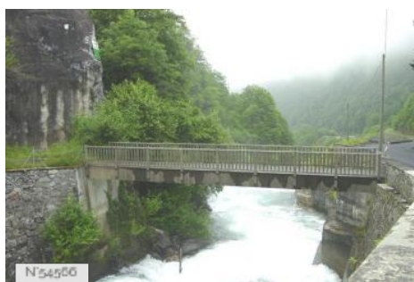
Le Gave de Cauterets à Cauterets