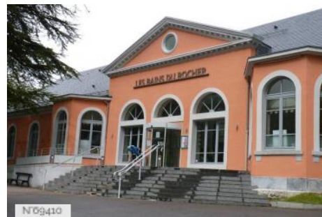
Thermes Bains du Rocher à Cauterets