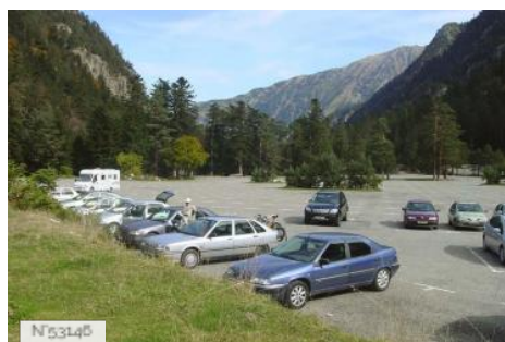
Parking du Pont d'Espagne - Cauterets