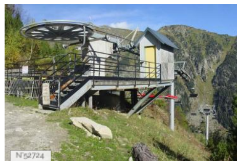
Télesiège de Gaube à Cauterets