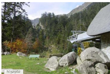
Télécabine du Puntas au Pont D'Espagne à Cauterets