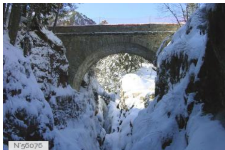
Pont d'Espagne à Cauterets (en Hiver)