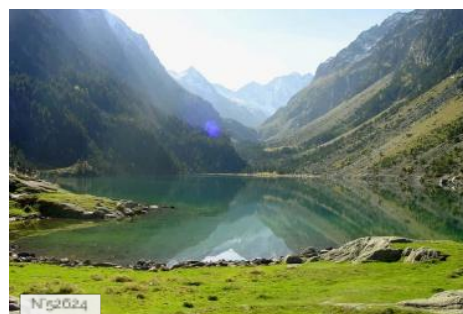
Lac de Gaube