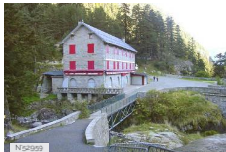
Hôtellerie du Pont d'Espagne à Cauterets