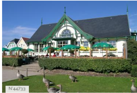
Bar du golf