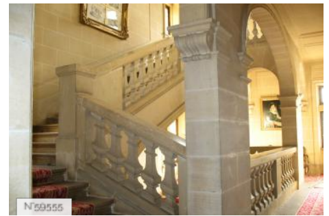
Château d'Avrilly - Grand Escalier