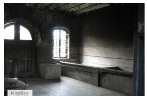
Château d'Avrilly - Communs - Buanderie et Grenier