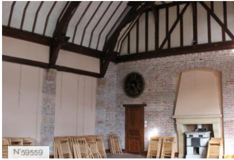
Château d'Avrilly - Orangerie