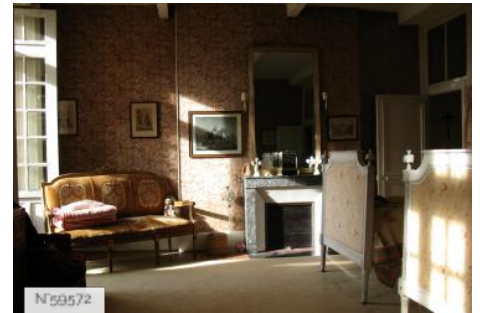
Château d'Avrilly - Grande Chambre