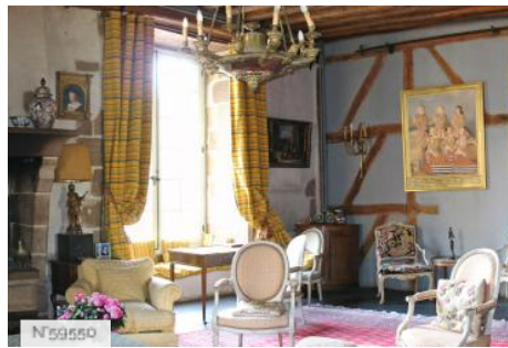
Château d'Avrilly - Salon Bleu