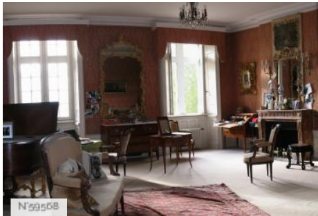
Château d'Avrilly - Chambre Piano