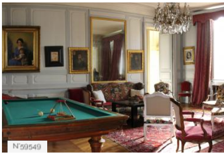
Château d'Avrilly - Salon Billard