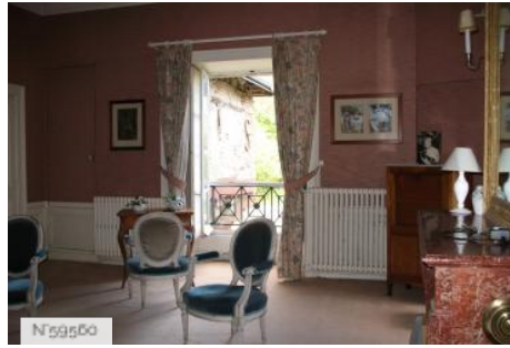
Château d'Avrilly - Chambre Rose