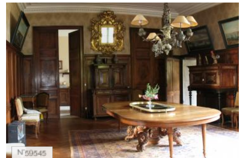
Château d'Avrilly - Grand Salon