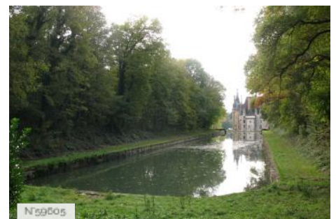
Château d'Avrilly - Entrées et Douves