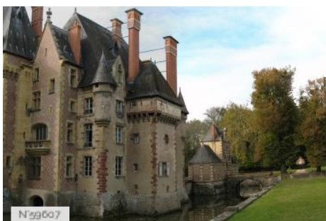
Château d'Avrilly - Extérieurs