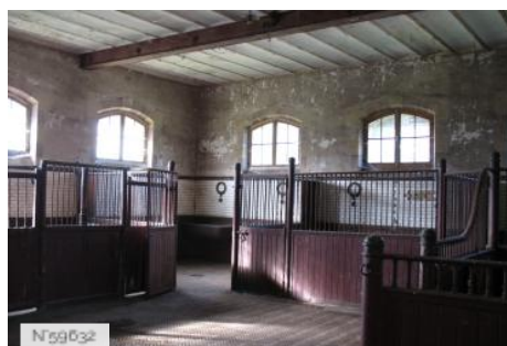
Château d'Avrilly - Communs - Ecuries