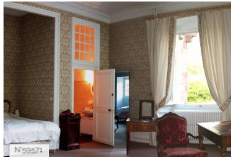
Château d'Avrilly - Chambre Beige