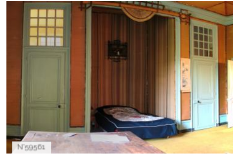
Château d'Avrilly - Chambre Asiatique