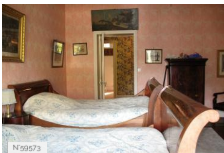
Château d'Avrilly - Chambre Saumon