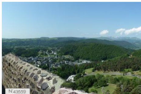
Château de Murol - Tour et chemin de ronde