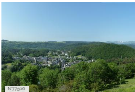
Château de Murol - Vue depuis le Château