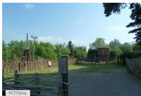
Château de Murol - Champ d'archerie