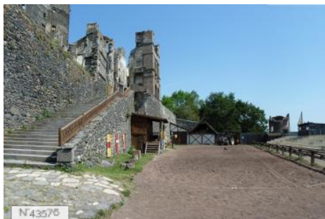
Château de Murol - Entrée - Champ d'honneur - Basse cour