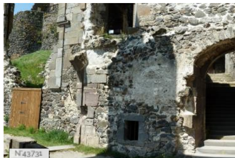
Château de Murol - Accès cour intérieure