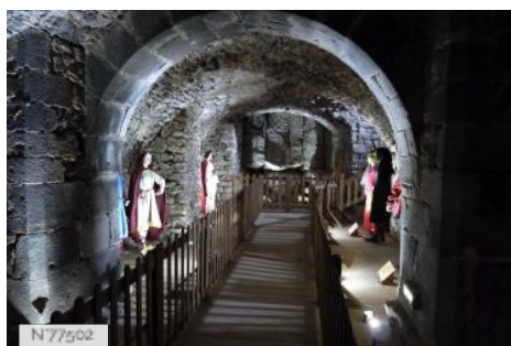
Château de Murol - Cellier