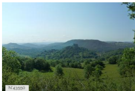
Château de Murol - Vues Générales