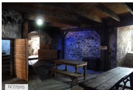
Château de Murol - Cuisines