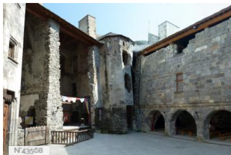
Château de Murol - Cour intérieure