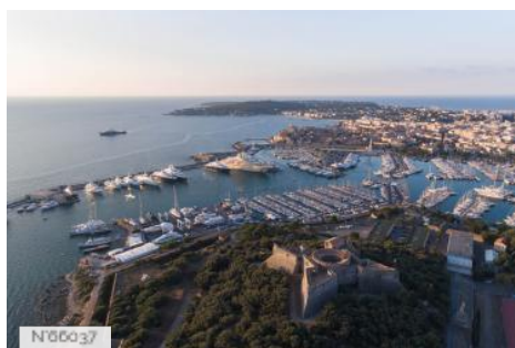
Port Vauban - Antibes