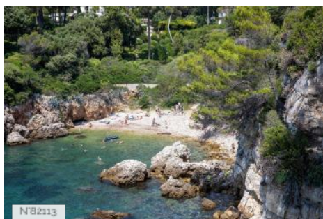
Plage de la Croupatassière - Antibes