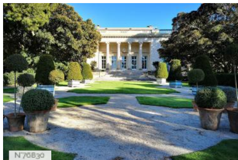
Villa Eilenroc Antibes