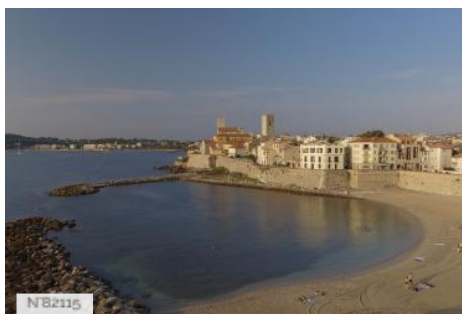
Plage de la Gravette - Antibes