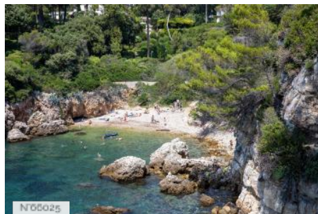
Plages du Cap d'Antibes