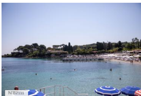
Plage de la Garoupe - Antibes