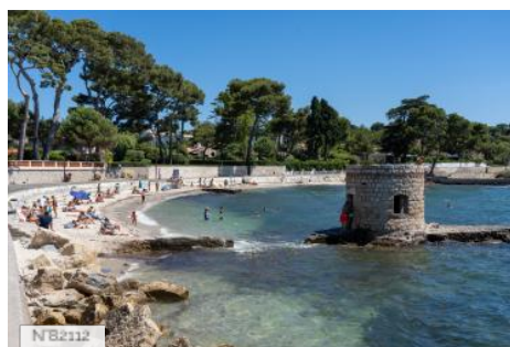
Plage des Ondes - Antibes