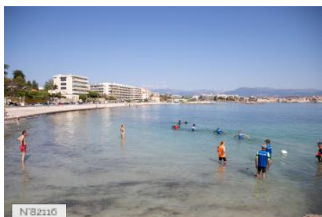
Plage de la Salis - Antibes