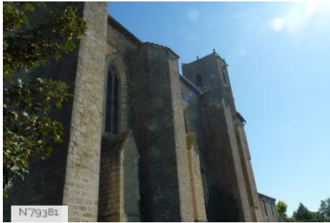
Collégiale Saint-Philippe et Saint-Jacques