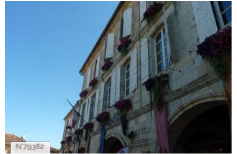
Mairie de Montréal du Gers