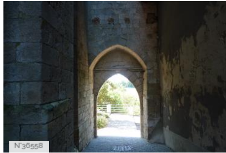
Porte de village