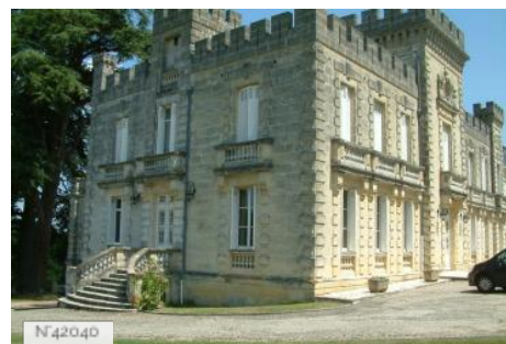
Château de Grand Branet - Capian