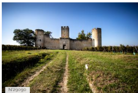
Château de Budos