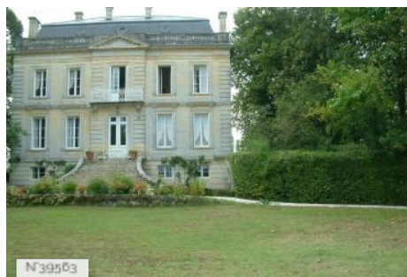
Château Le Mascaret - Beautiran