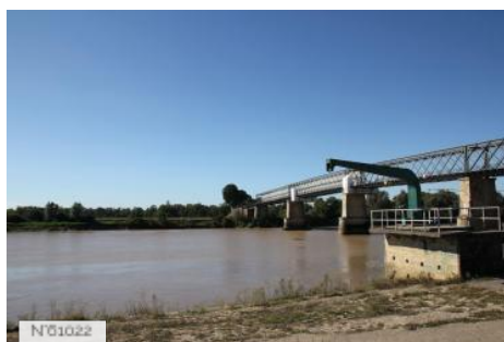
Pont Eiffel de Cadillac