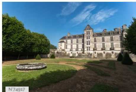
Jardins du Château de Cadillac