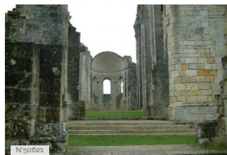
Abbaye de la Sauve-Majeure - Centre des Monuments Nationaux - la Sauve