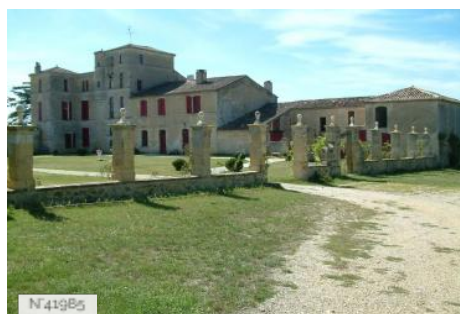
Château de Lacaussade - Baurech