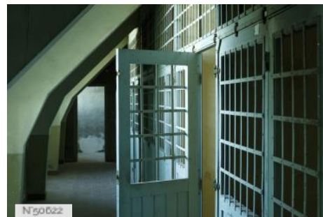
Prison du Château de Cadillac - Centre des Monuments Nationaux