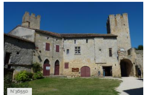
Porte de Larressingle