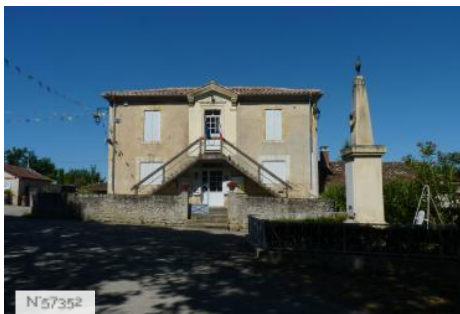
Mairie de Larressingle